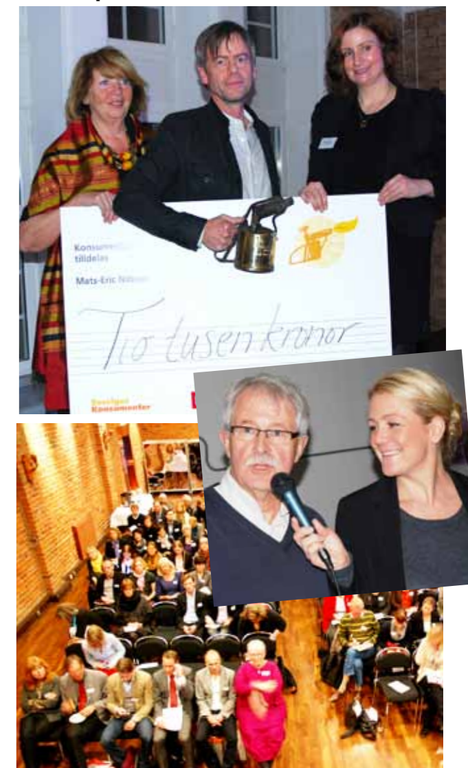
När 2010 års konsumentpris Blåslampan delades ut anordnas även ett mycket lyckat seminarium under rubriken "Konsument 2020 – spaning mot framtiden". Konsumentminister Birgitta Ohlsson delade ut årets pris.