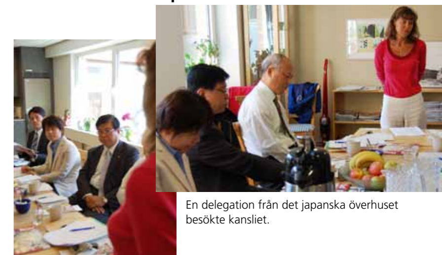
En delegation från det japanska överhuset besökte kansliet.