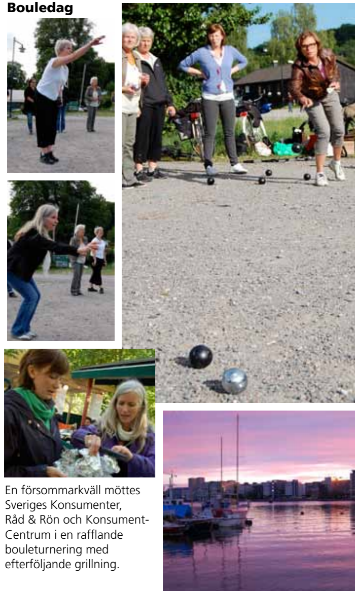
En försommarkväll möttes Sveriges Konsumenter, Råd & Rön och Konsument-Centrum i en rafflande bouleturnering med efterföljande grillning.