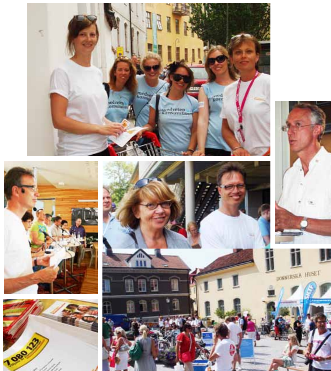
Vilket parti är konsumenternas bästa vän? Under Almedalsveckan i Visby anordnade Sveriges Konsumenter en utfrågning av partiernas konsumentpolitik inför valet 2010. Under parollen "7 080 123 väljare är konsumenter" spred vi information om vår valplattform på gator och torg.